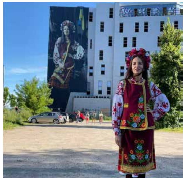
Рисунок 3. Мурал на Будинку Москви у Вільнюсі, Литва

На превеликий жаль, як слушно констатують в Українському культурному фронті, «під час війни креативні індустрії зазнали відтоку талантів, скорочення фінансування, зниження попиту на культурні продукти та послуги, негативних наслідків розірваних ланцюгів постачання. Державні кошти, які в мирний час виділялися на культуру, в умовах воєнного стану спрямовані на підтримку Збройних Сил України» [31]. Цілі та амбіції з розвитку культурних та креативних індустрій в Україні на 2022 рік були досить значні. Багато з них не були реалізовані, оскільки повномасштабна війна Росії проти України внесла свої корективи. Однак зараз Україна зіштовхнулася з пришвидшеними євроінтеграційними процесами, що буде значно сприяти розвитку