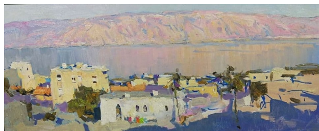
В. Шматько. Єрусалим. Галілейське море. Кесарія. 2013. Полотно, олія. 30x70