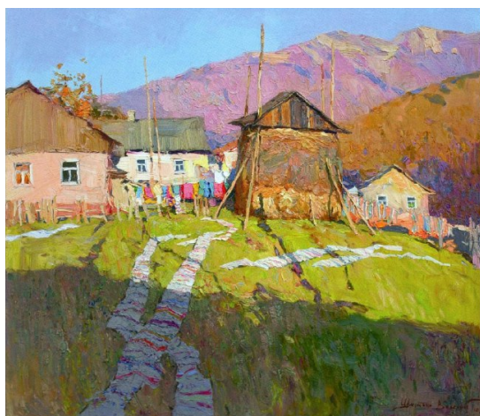
В. Шматько. Вечір у Колочаво. Жовтень. 2010. Полотно, олія. 70x80