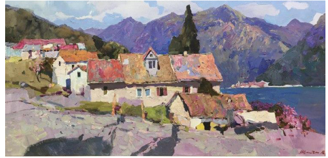
В. Шматько. Ранок. Домівки з червоними дахами. 2019. Полотно, олія. 40x80

Висновки. Валерій Шматько – художник-плерерист, представник харківської пейзажної школи, який успадкував глибоке емоційне