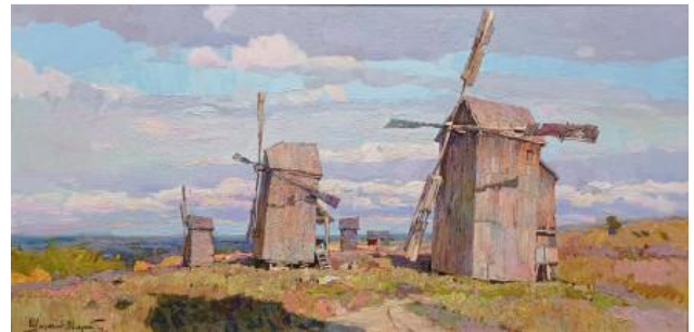
В. Шматько. Чигирин. Старі млини. 2012. Полотно, олія. 39,5x79,5

сприйняття природи, цікавість до історії та культури, простоту мотивів. Він – майстер живопису, який створив власний стиль, де традиція і класика поєдналися з живописною стилістикою художника ХХІ століття. Розвиток пейзажу у творчості В. Шматька пов'язаний зі сформованим поглядом на оточуючу дійсність та місце людини в ній. Він використовує імпресіоністичний метод передачі враження, емоцій, але все ж для нього пейзаж більше, ніж конкретний момент. Митець пише картини, в яких виражає сутність природи та менталітет народу, і іноді складно сказати, що саме є головним. Нині, у часи важких випробувань і безмірного захоплення національними цінностями (природа і культурно-мистецька спадщина, героїчна історія і традиції, ідеї і люди країни) у творчості В. Шматька слід очікувати збільшення національних мотивів, зображення українських сіл і міст як історико-культурного оточення буття українців, їхньої ідентичності й самобутності.