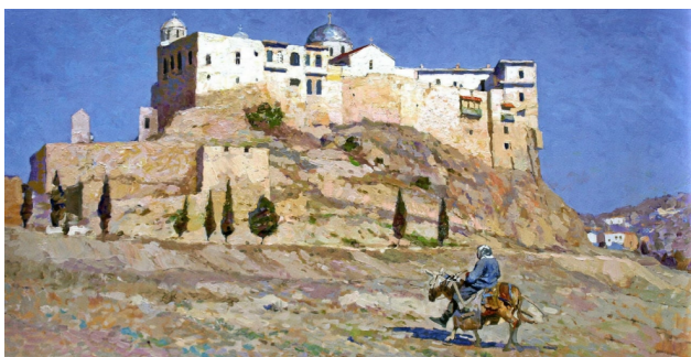
В. Шматько. Монастир Божої Матері в Сирії. 2008. Полотно, олія. 70x120

З плином часу пейзаж В. Шматька еволюціонує, бо художник постійно розвивається, вивчає творчість інших мистців, надихається їхнім мистецтвом. Він випробував різні техніки, стилі, розміри полотен, багато експериментує, вважає, що «треба все змінювати, щоб розвиватися та досягати нових емоційних настроїв» [4]; «на початку творчого шляху я писав пейзажі, які були більш