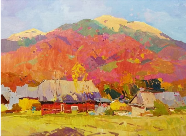
В. Шматько. У горах Колочави. 2018. Полотно, олія. 60x70

оповідальними, але нині я більше звертаю увагу на емоційну складову» [3]. Творчості останніх років притаманне узагальнення, відхід від деталізації, передача настрою, свобода живописного виконання, якої він досягає за допомогою техніки імпресіоністичного широкого письма. Утім, художник не вважає себе «чистим» імпресіоністом: «наприклад, роботи Левченка та Ткаченка мені ближчі, ніж роботи Моне та Пісарро. Елементи імпресіонізму використовували та використовують багато художників, не будучи при цьому «чистими» імпресіоністами. З цього напрямку я сприймаю почуття повітря, кольорові тіні та світло» [3]. Митець використовує яскраві відтінки, чистий, інтенсивний колір, який допомагає передати емоцію. Його живопис «збагачений валерними й тональними відтінками, що викликає відчуття дорогоцінної мозаїки: його колористичну поліфонію направлено в глибину, а не на поверхню, колористичні плями м'які і пружні, мерехтять всіма відтінками і відблисками... створене ним, сповнене дивовижної наснаги людини, для якої здатність самовираження в будь-якому жанрі образотворчості є природною потребою, сутністю самої душі...» [2, с. 426].