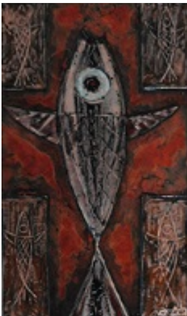
Тимко В. В. (Ужгород) Символ. 2015. Мідь, емаль, 35,3×20.

В роботах провідного художника-емальєра і активного прихильника відродження та розвитку традицій емальєрного мистецтва Олександра Бородая «Стихія» (ДВП, левкас, віск, мідь, емаль, скло. 2015) і «Всесвіт»