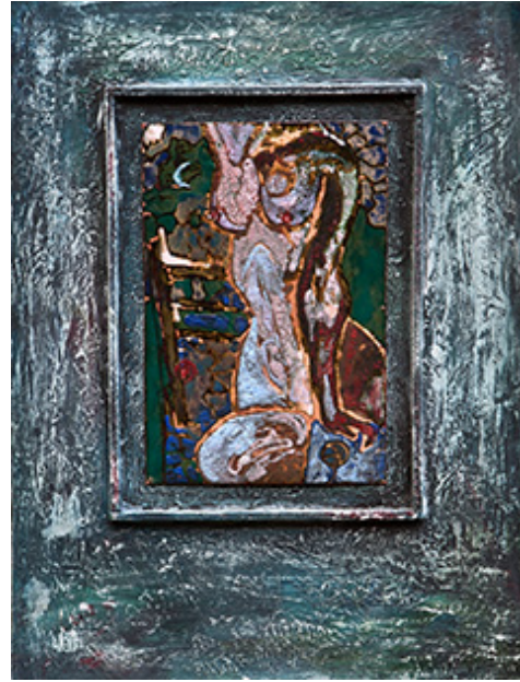
О.Л. Антонюк (Дніпро). Без назви. 2015. ДСП, левкас, мідь, емаль, 22×42,5.

живописної техніки [рис. Б.3.3]. В іншій роботі під назвою «Захід сонця» (мідь, емаль, левкас, 2015) митець висвітлює жіночу впевненість, що походить від гордовитої постави фігури жінки, яка тримає в піднятій руці келих, а інша підперає бік. Жінка зображена на тлі вечірнього сонця. Ще в одній роботі майстер відображає світ жіночих мрій і зображає жінку на хвилях своїх надій перемезаних відображенням яскравих спалахів зірок у воді.