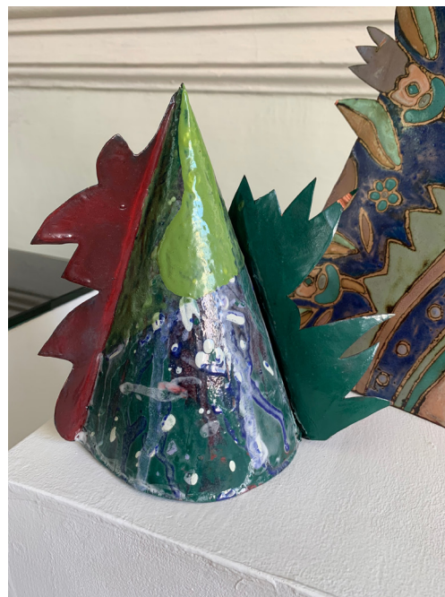
Ю.О. Бородай Квітковий календар 1. 2004. Мідь, емаль.

Об'ємно-просторові композиції Юлії Бородай по суті продовжують розпочату групою Олексія Роготченка тенденцію виходу за межі станкового та монументального мистецтва в емалі до його пластичних форм. І це слід зазначити як тенденцію у розвитку мистецтва живописної емалі. Такі та інші твори емальєрної пластики з'являються у кінці ХХ століття і їх виготовлення має своє продовження на початку ХХІ століття.