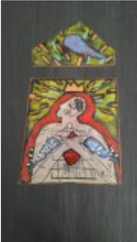
М.М. Луцик (Київ) Право на владу. 2015. Мідь, емаль, левкас 60×30,5.