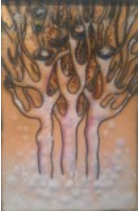
Н.С. Княжковська (Одеса) Спустошені гнізда. 1988. Мідь, перегородчаста емаль, 39×44.

є зображення птаха, що високо парить на тлі блакиті неба. Навколо птаха по колу у вихорі кружляє золотаве листя. З'являється відчуття прощання із літньою порою року. Інший її твір «Древо життя» (мідь, емаль, 2015) відображає яскравість минулого – силует могутнього дерева без листя на тлі зеленкуватого диску сонця з червоно гарячими протуберанцями навколо яких різноманіття кольорів, як символіка різноманіття життя.