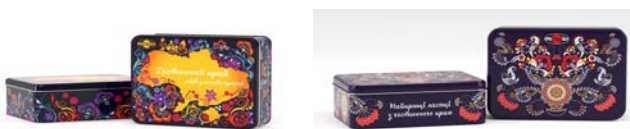
Рис. 2. Дизайн упаковки цукерок «Асорті» ТМ «Пригощайся»

Тенденції ринку показують, що більшість сувенірних дизайн-проєктів характеризуються яскравістю та насиченістю кольорів. У контексті українських сувенірних цукерок дизайн часто включає синьо-жовті тони, зображення герба України та фотографічні елементи українських пам'яток. Також популярними є ретро-стиль та використання орнаментів вишиванки [5, с. 200].