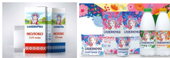
Рис. 3. Дизайн пакування торгової марки «Слов'яночка»: а – дизайн 2002 р., б – дизайн 2022 р.

Також в роботі проведено аналіз дизайну пакування продукції торгової марки «Слов'яночка». Саме в цьому випадку досліджено ребрендинг упакування, яке відійшло від геометричного орнаменту (рис. 3, а) на користь рослинного (рис. 4, б).