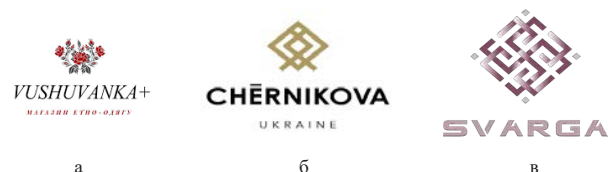
Рис. 1. Зразки дизайну логотипів з використанням орнаментальних мотивів: а – бренд «Вишиванка», б – бренд «Чернікова», в – бренд «Сварга»

Особливо цікавим і популярним нині є використання елементів традиційних українських розписів, таких як петриківський, самчиківський, яворівський, миколаївський, косівський та інші. Ці розписи є візитівкою української культури і мають великий попит у дизайні поліграфічної продукції [4, с. 274]. Вони додають роботам дизайнерів унікальності та допомагають підкреслити національну ідентичність, створюючи міцний зв'язок між минулим і сучасним.