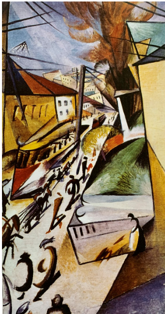
Іл. 1. Олександр БОГОМАЗОВ. Київ. Львівська вулиця (Трамвай). 1914. Олія на полотні

Внесок Олександра Богомазова в становлення та утвердження українського авангарду ілюструє динамічну взаємодію локальних і глобальних впливів у розвитку сучасного мистецтва. Його творчість не лише відображає ширші тенденції європейського модернізму, але й утверджує виразну українську ідентичність, кидаючи виклик монолітному наративу західного модернізму. Доєднуючись як до соціально-політичного контексту, так і до теоретичних аспектів конкретно-історичного періоду, Богомазов допоміг сформуванню унікальну теоретичну основу українського авангарду висловлену у його маніфесті, законі змін, теорії елементів живопису та теорії основних елементів сутності мистецтва.