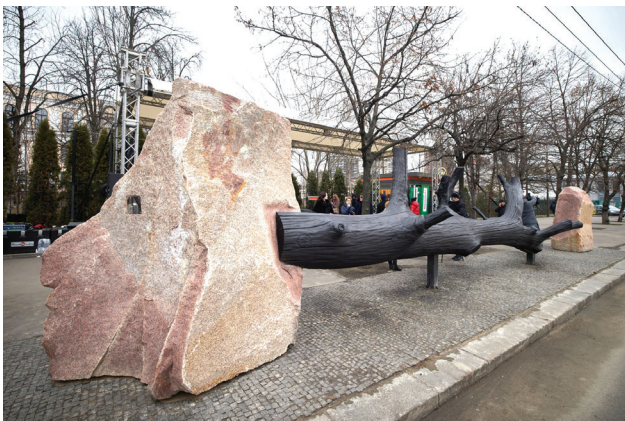
Рис. 3. Берестейський проспект 10 Погляд у минуле

Кам'яні валуни розташовані на відстані близько 10 метрів один від одного, створюють просторову глибину та розчленованість у композиції. Чорний стовбур дуба що лежить