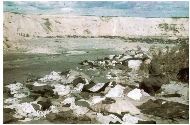
Рис. 2. Німецький солдат порпається в речах розстріляних євреїв, 1 жовтня 1941 року

між ними, додає горизонтальний елемент та контраст до вертикального ритму каменів. Світло-бурі кам'яні валуни гармонійно вписуються в природні ландшафти, що оточують дорогу. Чорний колір стовбура дуба зберігає нейтральність та дозволяє спокійно існувати в будь-якому середовищі. Валуні зберігають природну форму, але вмонтовані в них монокулари з фотографіями трансформують спосіб, яким їх сприймає глядач, роблячи їх не просто кам'яними масами, а історичними артефактами. Фотографії вбудовані у валуни, надаючи їм додатковий контекст та значення. Це погляд у минуле через лінзу фотокамери, що дозволяє відвідувачам зануритися у трагічну атмосферу минулого та відчуті цінність сьогодення.