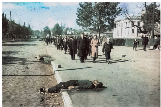
Рис. 4. Люди проходять повз тіла вбитих – імовірно, євреїв, які відмовилися прийти до Бабиного Яру

між ними, додає горизонтальний елемент та контраст до вертикального ритму каменів. Світло-бурі кам'яні валуни гармонійно вписуються в природні ландшафти, що оточують дорогу. Чорний колір стовбура дуба зберігає нейтральність та дозволяє спокійно існувати в будь-якому середовищі. Валуні зберігають природну форму, але вмонтовані в них монокулари з фотографіями трансформують спосіб, яким їх сприймає глядач, роблячи їх не просто кам'яними масами, а історичними артефактами. Фотографії вбудовані у валуни, надаючи їм додатковий контекст та значення. Це погляд у минуле через лінзу фотокамери, що дозволяє відвідувачам зануритися у трагічну атмосферу минулого та відчуті цінність сьогодення.