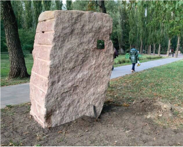
Рис. 1. Валун з монокуляром в парково-меморіальному комплексі Бабин Яр

За допомогою монокулярів, вмонтованих у кам'яні валуни, глядачі можуть переглянути фотографії зроблені на цьому місці в 1941 році, на яких видно тіла двох убитих чоловіків, які лежать на проспекті, і натовп, що проходить повз (рис. 4). Обрізаний стовбур дуба, що лежить між валунами, є символом перерваного життя, і використовується для підкреслення трагічності та загибелі, які представлені на фотографіях. Його розташування між кам'яними валунами і фотографіями підсилює атмосферу траурного пам'ятника та створює контраст між живим і мертвим.