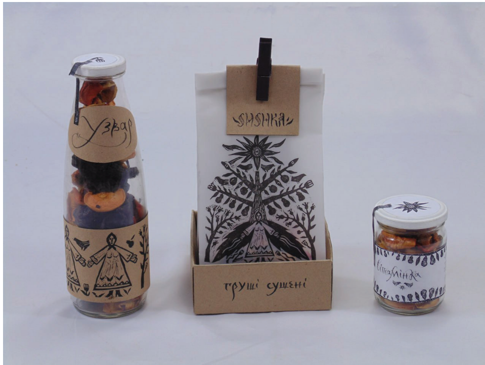
Рис. 3. Проект студентки ХДАДМ Олени Двухглавої

сушених груш («Сушка») та скляну банку для сушених фруктів («Вітамінка»).