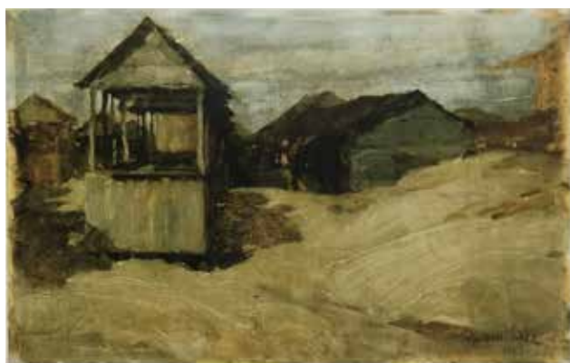
Іл. 1. Абрам Маневич, етюд, 1905