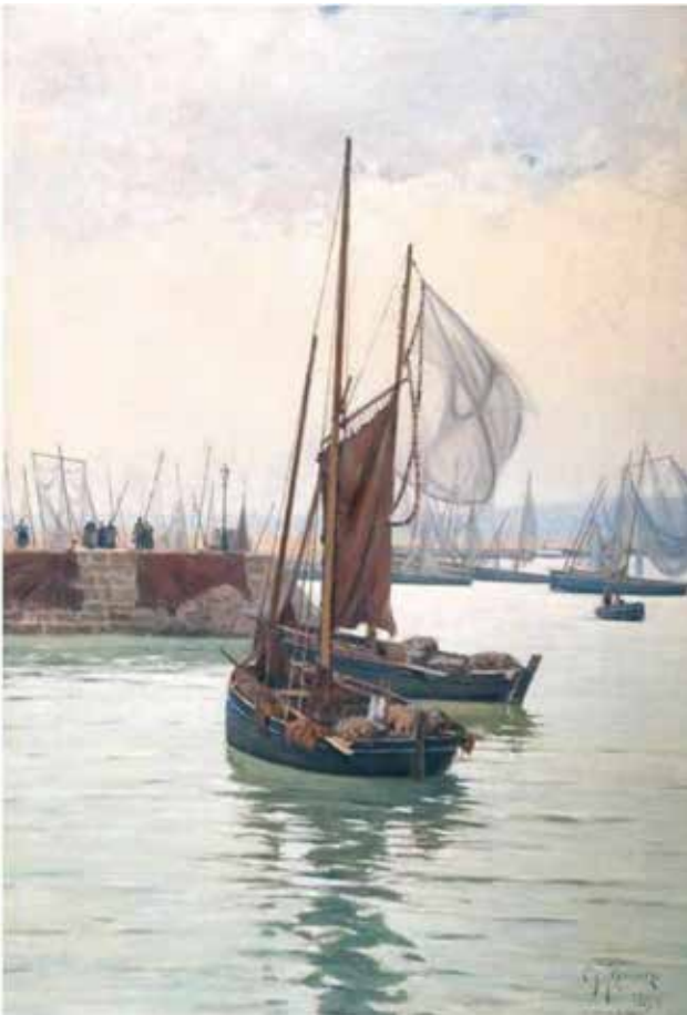
Іл. 3. М. Ткаченко «Рибацькі човни в порту Дуарнене.» Бретань 1894

Інший яскравий представник Харківської живописної школи, випускник Харківського реального училища та Петербурзької Академії мистецтв Михайло Ткаченко. По закінченню імператорської академії поїхав навчався до Парижа [4, с. 326], в академію мистецтв Кормона, де навчався у 1888–1892 роках, там він був неодноразово відзначений, за видатні успіхи у навчанні. З 1891 року почав брати участь у Паризьких Салонах, де у 1904 році виставив полотно «Закинута татарське кладовище. Крим» та на Салоні 1907 року [5, с. 198] виставив два українських пейзажа «Тіні насуються» та «Йде сніг. Україна», того ж року «Покровський монастир у Харкові» на Великому салоні; після чого провів персональну виставку у Парижі, на якій були представлені 62 картині і десятки етюдів, і у 1910 році знов прийняв участь у Паризькому салоні. На прикладі двох робіт «Рибацькі човни в порту Дуарнене» (іл. 3) та «Село на березі» (іл. 4) написані у Франції, у Бретані, чітко контрастують