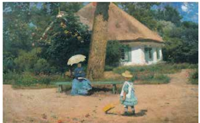
Іл. 5. М. Ткаченко «Сім'я на відпочинку»

Також, ознайомимось з життєписом Сергія Костенко. Він закінчив Київську рисувальну школу М. Мурашка у М. Пимоненка у 1889 році [6, с. 12–16], після чого брав участь у розписах Володимирського собору та відновленню розписів Кирилівської церкви [7, с. 76]. А вже згодом у 1893 році, вирушив на навчання до Парижу, в Академію мистецтв Жульєна. В 1894 році, Сергій Костенко прийняв участь в Салоні на Марсовому полі [8, с. 13–21] з полотном « У звіринця», яке відзначив І. Є. Рєпін, що згадується у його «Листах про мистецтво». Також оцінити автора можемо по його відомих роботах, які збереглись до сьогодні та представлені в колекції НХМУ «За уроком» (іл. 6)