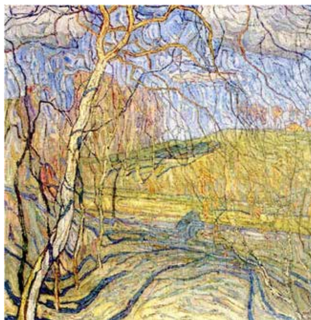
Іл. 2. Абрам Маневич, «Весняна симфонія» 1912, НХМУ

Виклад основного матеріалу. Чимало українських митців на зламі століть мали складний творчий шлях, який лежав через поневіряння та карколомний успіх. Розглянемо декількох з них. Абрам Маневич почав свій шлях вивчення образотворчого мистецтва в 1901–1905 роках у Київському художньому училищі. В 1904 році отримав трьох річну стипендію для продовження навчання у Мюнхені, де у 1905–1906 роках навчався у всесвітньовідомій Школі Антона Ашбе. У 1907 році почалась активна виставкова діяльність Маневича персональною виставкою у галереї Kunst Verein у Мюнхені та 1908 року [1, с. 213] участю у виставці «Сецесіон» у Відні. Дебют молодого митця продовжився у Парижі де на весняному Салоні [2, с. 13–14] на Марсовому полі долучився до участі двома полотнами: «Єврейське містечко» і «Жовтень», а вже у 1913 році [3, с. 408] провів персональну виставку у паризькій галереї Дюран-Руеля.