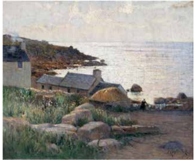
Іл. 4. М. Ткаченко «Село на березі» Бретань 1910

з картиною «Сім'я на відпочинку» (іл. 5). Хоч вона ближча нам по контексту, проте дві інші роботи чітко відображають типовий сюжет зображення французького узбережжя.