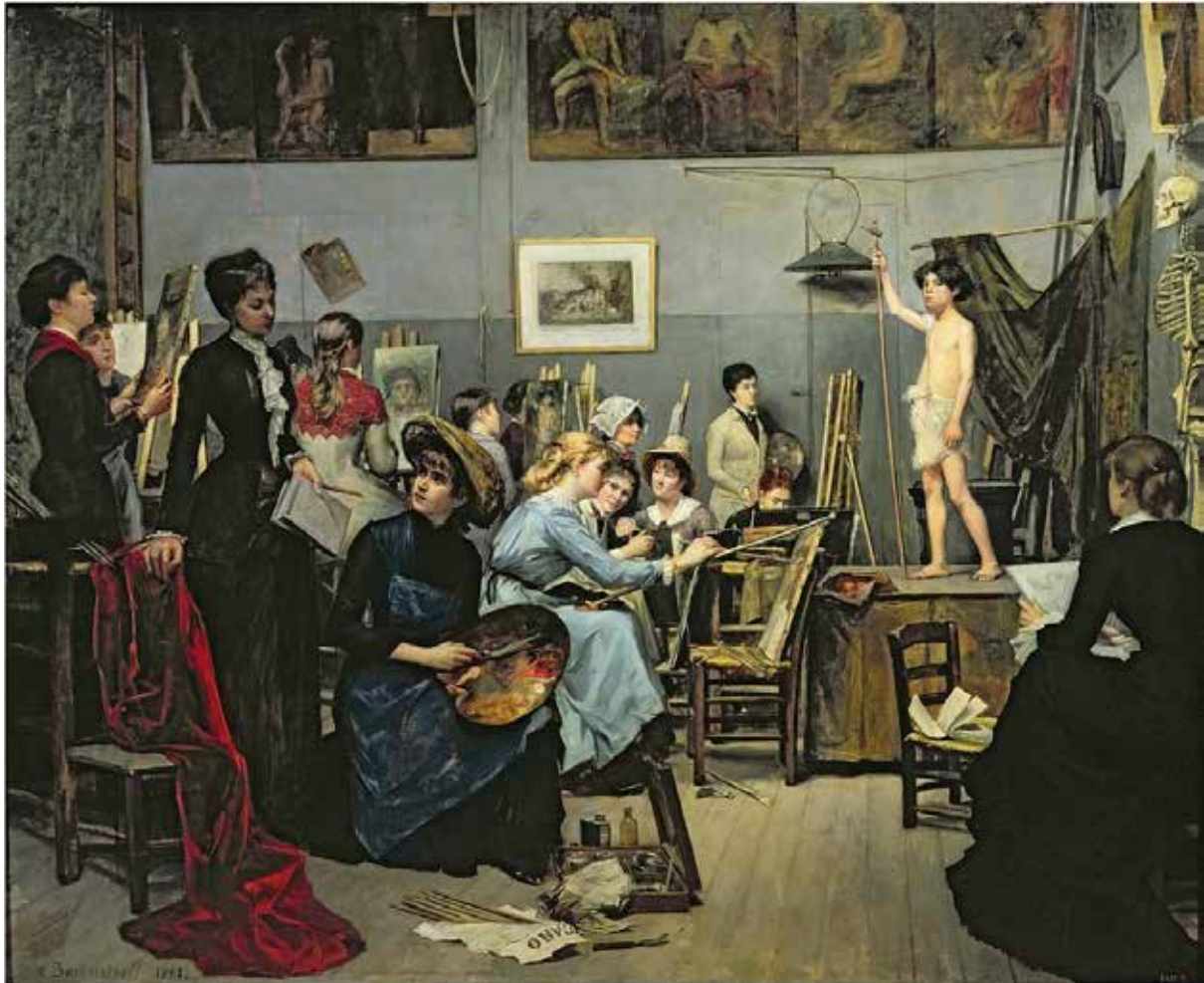
Іл. 8. М. Башкирцева В майстерні. 1881

можемо зробити прогнозування мистець- ває перед нами поле подальших наукових ких тенденцій сьогодення, що відкри- пошуків.