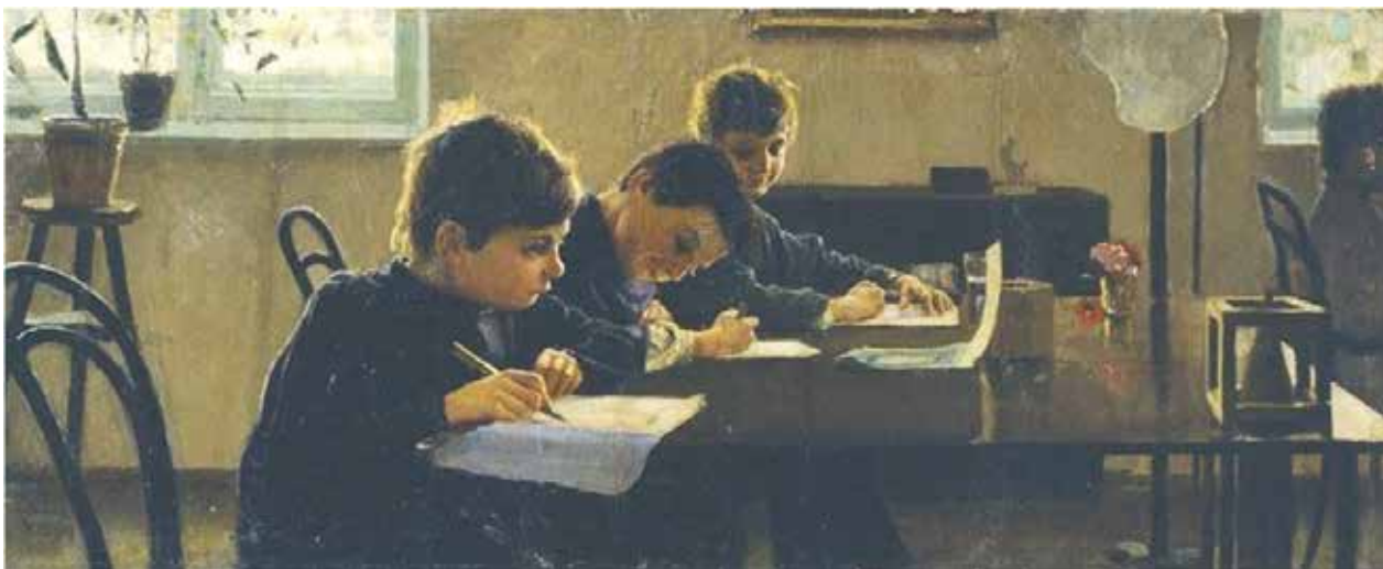
Іл. 6. С. Костенко «За уроком» 1891

та «Вечір над Дніпром» (Іл. 7) [9, с. 125]. Якщо перша робота нам демонструє майстерне володіння композицією і тоном, то вже в другій роботі ми бачимо неперевершене володіння кольором у вечірньому пейзажі, який написаний етюдно.