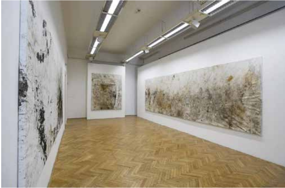
Виставка «Бруд 0». Сельма Сельман. 2021

сучасна польська художниця ромського походження Малгожата Мірґа-Тас. Мисткиня здобула широке міжнародне визнання завдяки сміливому авторському переосмисленню образів та сюжетів, пов'язаних з ромською тематикою. У своїй творчості мисткиня звертається до ромської іконографії, переосмислює та деконструє традиційні уявлення та стереотипні зображення представників цієї етнічної групи. Працює в техніці інсталяцій, відеоарту, живопису. Її мистецькі твори з реінтерпретації культурних наративів та сприяння міжкультурному діалогу принесли художниці численні міжнародні нагороди та визнання у світі мистецтва [12].