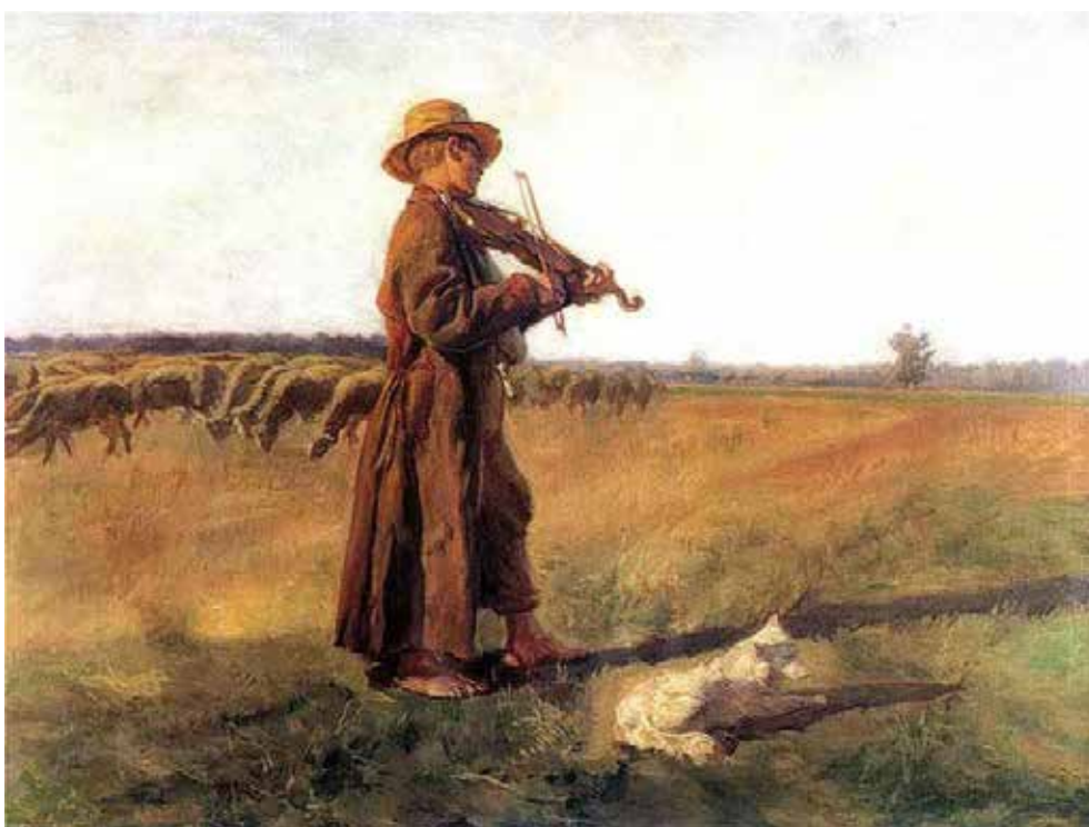
Рис. 6. Юзеф Хелмонський «Пастух» (1897)

Композиційним центром є самотня постать пастуха зі скрипкою. Вертикаль фігури контрастує з горизонтальними лініями пейзажу, підкреслюючи усамітненість персонажа. Увага сконцентрована на його творчому натхненні. Пасторальний сюжет полотна занурює глядача в атмосферу ліричного спокою та гармо-