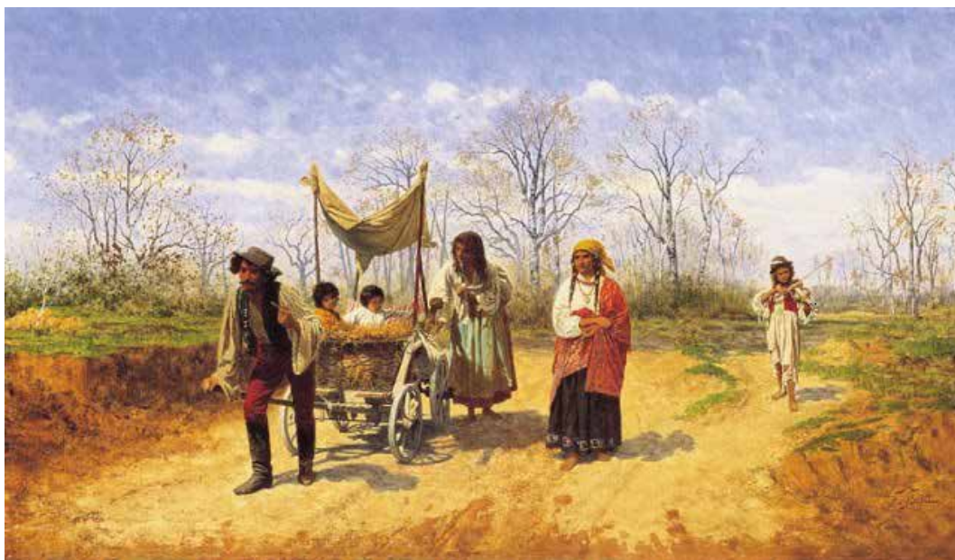
Рис. 2. Франтішек Стрейтт «Мандрівні цигани» (1887)