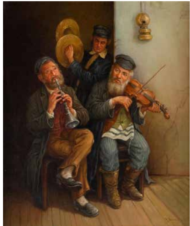
Рис. 4. Костянтин Шевченко «Концерт», пер пол. XX ст.

Не менш популярною в творчості польських митців обраного періоду була єврейська тематика. Художники охоче зображали уклад життя мешканців єврейських містечок-штетлів, їхній побут, культуру й мистецтво, релігійні вірування. Картина Костянтина Шевченка ( Konstantin Szewczenko ) «Концерт» присвячена колективу з трьох єврейських музикантів (скрипка, ударні та духові інструменти), одягнених в традиційний єврейський чоловічий костюм кінця XIX ст (Рис. 4). Тут яскраво продемонстровано, що саме скрипка є центральною віссю музичних колективів, які запрошувались на весілля та інші свята. Попри доволі однорідну колористику, з мінімумом контрастів, не випадково автор зобразив скрипаля у світліших тонах, акцентувавши саме на ньому (інші два музиканти ніби знаходяться в тіні), адже меланхолійні та одночасно оптимістичні скрипкові мелодії як ніякі інші описували життя та історію єврейського народу в Європі, що вмів «посміхатись крізь сльози».