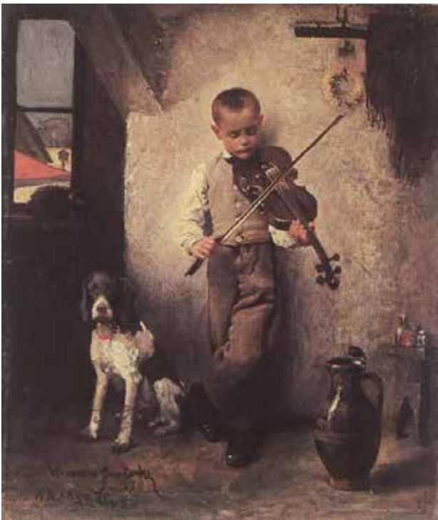
Рис. 7. Вандалін Стшалецький «Скрипаль» (1874)

Картина «Скрипаль» Вандаліна Стшалецького ( Wandalin Strzalecki ) зображує хлопчика років семи, в сорочці й брюках, який грає на скрипці, стоячи в кутку будинку біля вікна, спершись на стінку (Рис. 7). Полотно демонструє реалістичне зображення юного скрипаля в побутовому оточенні. Вдала побудова простору – спірання на задній план та розташування у глибині сцени створює ефект об'ємності та самостійності центрального персонажа [6]. Реалістичне змалювання одягу, пози та виразу обличчя маленького скрипаля доповнює враження достовірності та конкретики зображення. Разом з тим ліричний настрій твору підкреслює увагу до внутрішнього світу і творчого пориву талановитої дитини. Техніка виконання вирізняється м'яким мазком, узагальненим моделюванням форм за допомогою світлотіні. Картина втілює реалістичне бачення навколишнього світу в поєднанні з лірико-романтичним трактуванням художнього образу юного музиканта.