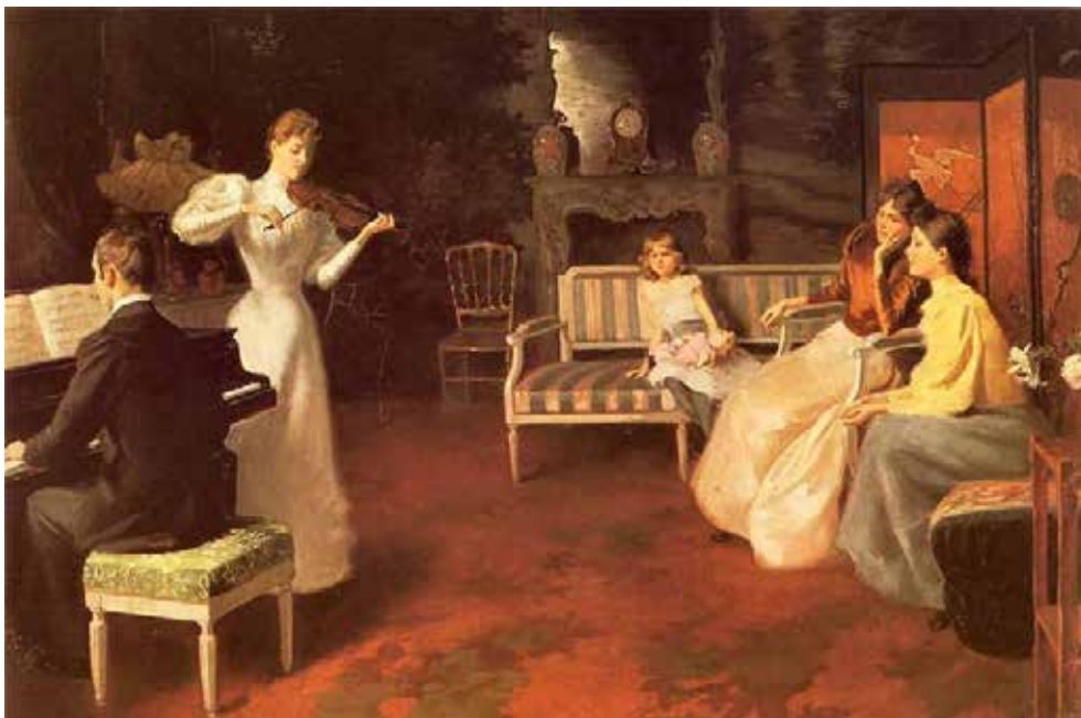
Рис. 5. Вінцентій Водзіновський «Концерт у Домі» (1890)