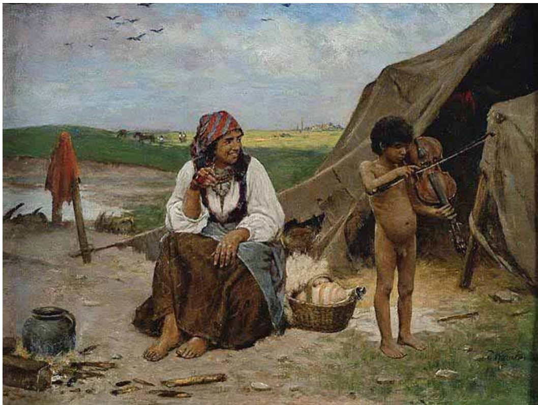
Рис. 1. Антоні Козакевич «Маленький віртуоз», кін. XIX ст.

геніального від природи. Скрипка символізує музичний дар маленького скрипаля. Образ живописно відтворює уявлення про вільних мандрівних ромів як носіїв незвичайної обдарованості й вродженого музичного таланту.