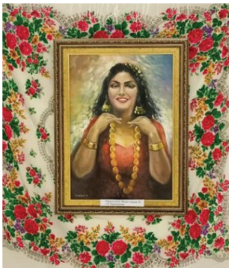
Рис. 8. Тиберій Йонаш, портрет циганки з золотими прикрасами (рік створення невідомий)

ширеніших поєднань кольорів при втіленні митцями в життя постатей ромок) – символічний натяк на темперамент молодої циганки (Рис. 8).