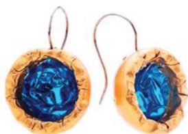
Рис. 6. Золоті сережки з фондів Музею ромської культури в м. Брно (Чехія).

На сьогодні одна з найбільших колекцій виробів із золота зберігається в фонді ювелірних виробів та коштовностей Музею ромської культури в м. Брно (Чехія), заснованому в 1991 р. – осередку збереження, дослідження й пропагування культурної спадщини циган всього світу через виставкові та інші проекти з відображення різноманітних традицій, релігії, звичаїв і побуту (Рис. 6) [7].