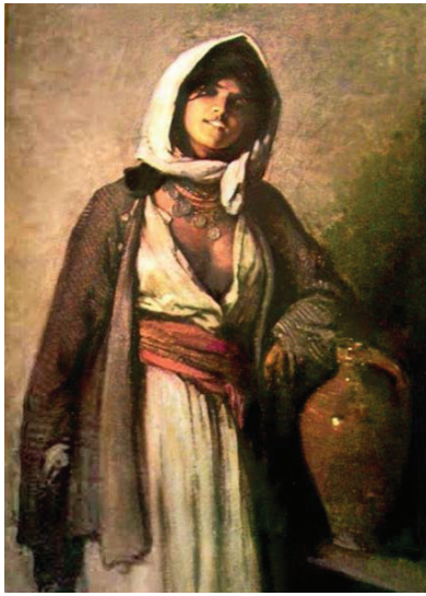
Рис. 3. Ніколає Григореску «Циганка із Гергань» (1872)

нічним елементом її костюма та всієї ромської культури (Рис. 4).