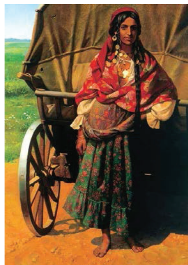
Рис. 7. Микола Бессонов «Патріна» (2000-і рр.)

Золото відтіняється червоною хусткою і тканиною-накидкою, чорним довгим волоссям, заплетеним в косу і смаглявою шкірою. На противагу барвистому багатошаровому вбранню, привертають увагу босі ноги дівчини. Це є промовистим підтвердженням того факту з циганського життя про те, що взуття можна не мати, але комплект прикрас (і не один) неодмінно повинен бути у власності жінки (Рис. 7).