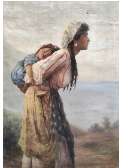
Рис. 4. Харитон Платонов «Циганка» (1904)

Адже саме золоті вироби у ритмі кочового циганського життя виконували функцію компактного матеріального активу, який можна було легко переносити на собі, і в разі потреби – подарувати, продати, обміняти або закласти в лихварів під відсотки. Так, циганка після того, як чоловік її виганяв з дому, або ж якщо траплялось вигнання з табору, могла вижити саме завдяки золоту, значна частина з якого була її весільним приданим, яким мала право користуватись лише вона. Тож, картина Х. Платонова, ймовірно, описує саме цю трагічну сторону циганських традицій.