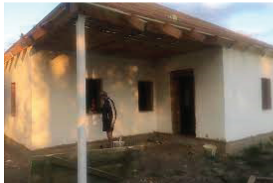
Рис. 11. Музей-садиба Остапа Вишні після затоплення (2023)

очерету). Внаслідок затоплення рівень води всередині будівлі піднявся до вікон, вся глина та вапно були знищені, в приміщенні залишились мул та бруд. Експонати були врятовані працівниками музею садиби ще до затоплення та зберігаються поза його межами.