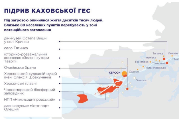
Рис. 3. Схематичне зображення найвидатніших пам'яток та природніх рекреаційних ресурсів, які опинилися під загрозою через підлив російськими військовими дамби Каховської ГЕС, розроблена фахівцями Державного агентства розвитку туризму України

фахівцями Державного агентства розвитку туризму України (Рис. 3).