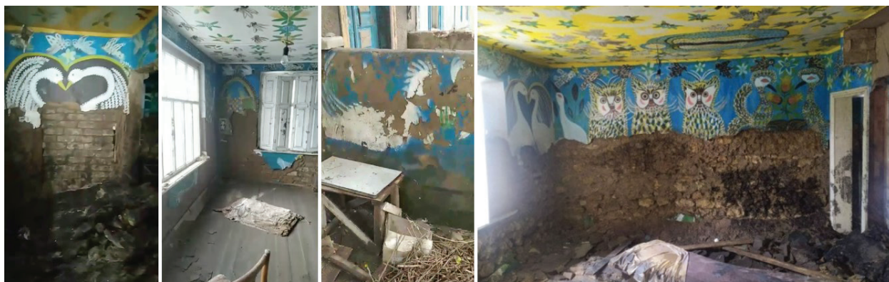
Рис. 8. Фрагменти інтер'єру будинку Поліни Райко після затоплення (червень, 2023) р.

ляцію, тематичні плакати й показ документальних фільмів.