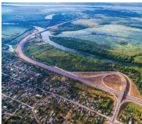
Рис. 1. Панорама м. Олешки Херсонського р-ну (2021)