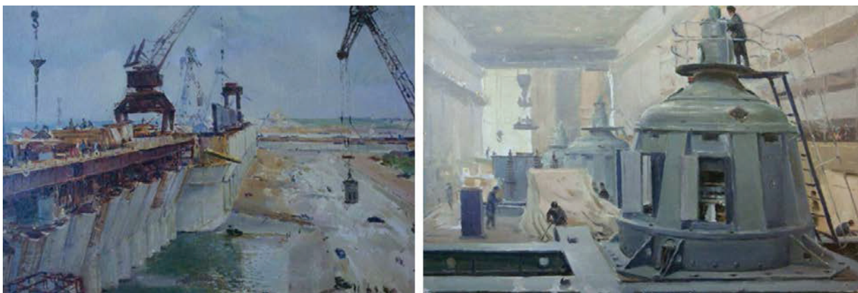
Рис. 9. Твори А. Гавдзинського з циклу, присвяченого будівництву Каховської ГЕС в середині ХХ століття

видатного художника, що нині є цінними свідченнями всіх етапів зведення Каховської ГЕС, яка припинила своє існування.