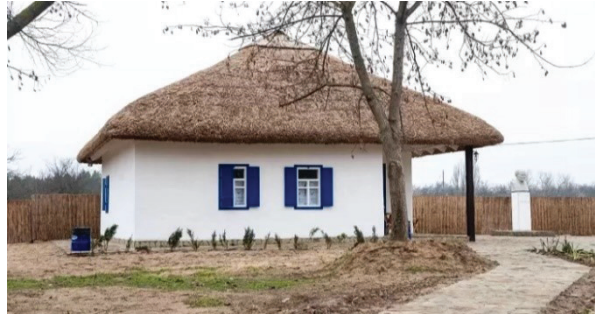
Рис. 10. Музей-садиба Остапа Вишні (2021)