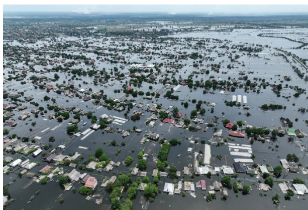
Рис. 2. Панорама м. Олешки Херсонського р-ну після затоплення (2023)

Крім рятувальних заходів, які проводились на місцях, на рівні органів державної влади було вжито заходи, які стосувались саме культурно-мистецької сфери. Так, на початку липня 2023 року, згідно з Розпорядженням Кабінету Міністрів України від 30 червня 2023 р. № 590-р, було створено міжвідомчий Координаційний центр зі збереження культурної спадщини та культурних цінностей на територіях, що постраждали внаслідок руйнування Каховської ГЕС. Його очолив О. Ткаченко, Міністр культури та інформаційної політики. До складу Координаційного центру увійшли представники Міністерства внутрішніх справ України, Міністерства інфраструктури України, Міністерства культури та інформаційної політики, Міністерства оборони України, Міністерства освіти і науки України, Національної поліції України, Інституту археології НАН України, Сили територіальної оборони ЗСУ, Дніпропе-