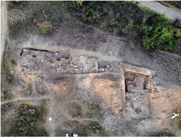
Рис. 4. Аерофотозйомка фортеці Тягинь (с. Тягинка Бериславського р-ну) до затоплення

залишки укріплень, споруд та археологічних розкопів [13].