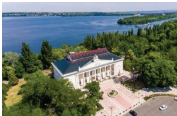
Рис. 5. Палац культури в м. Нова Каховка (2021)