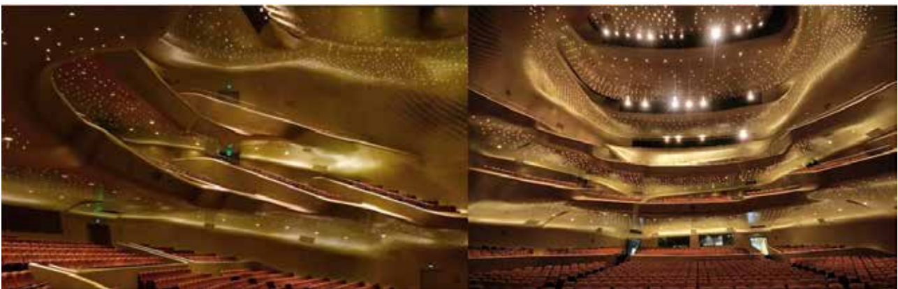
Рис. 3. Оперний театр в Гуанчжоу. Велика зала. Бічний та фронтальний вигляд

Висновки. Ідея Оперного театру в Гуанчжоу, відобразила специфіку ландшафту, культурні історичні традиції краю, сучасний