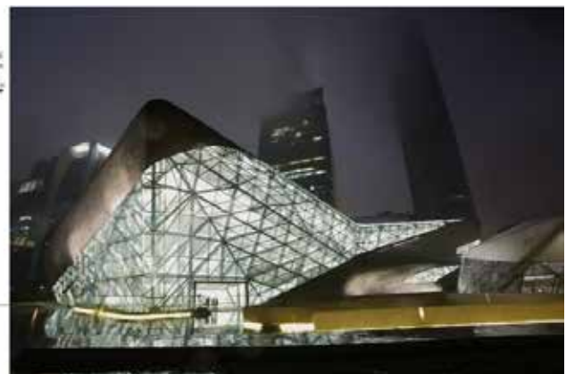
Рис. 1. Заха Хадід. Проект Оперного театру та його реалізація. Гуанчжоу, Китай