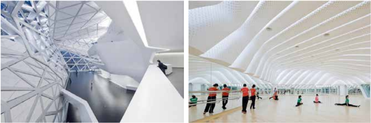
Рис. 4. Інтер'єри приміщень Оперного театру в Гуанчжоу: холи та репетиційні зали

дизайн архітектури та технології. Театр Захи Хадід втілює образ майбутнього.