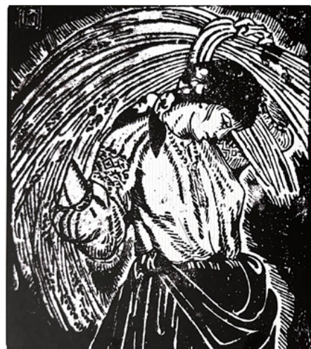
Рис. 6. лінорит «Жінка зі снопом» автор О. Кульчицька, 1943 р. Графіка, малярство, ужиткове мист., м. Львів, 2013 [1]