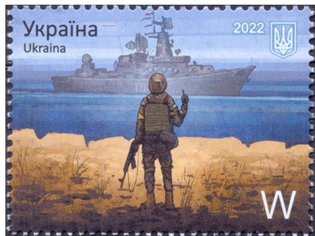
Рис. 10. Поштова марка, «Русській воєнний корабель...» автор Борис Грох, 2022 р.

Ці відважні люди вже є легендами і відомими настільки, що стали візуальними символами сили духу, героїчності, нескореності, віри у свою справу. Мабуть, з часом вони, як і козак Мамай, колись набудуть містичних рис та будуть наділені надприродними силами у художніх творах та творах образотворчого мистецтва.