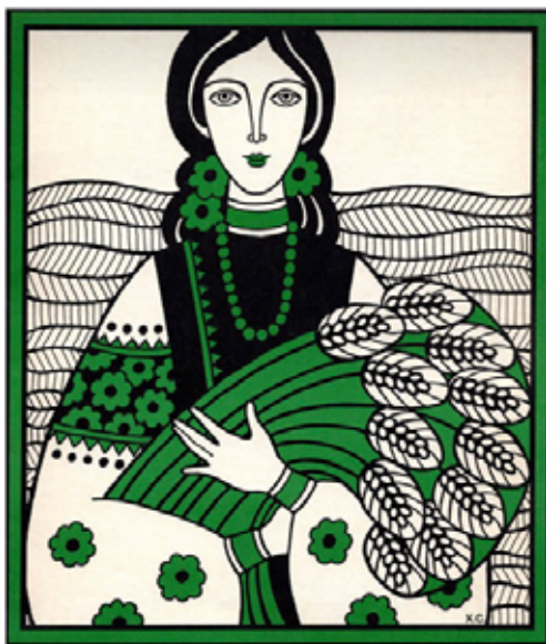
Рис. 7. Графіка, обкладинка, журнал «Жіночий світ», 1985 р. Торонто, 1985 р.

Ніл Хасевич, художник УПА, в міжвоєнний період створив такі монохромні дереворити: «На Волині жито ворогами збито» 1948 р., «Людей у ярма запрягли» 1949 р., «А їсти нічого» 1949 р., «За плугом» 1945 р.,