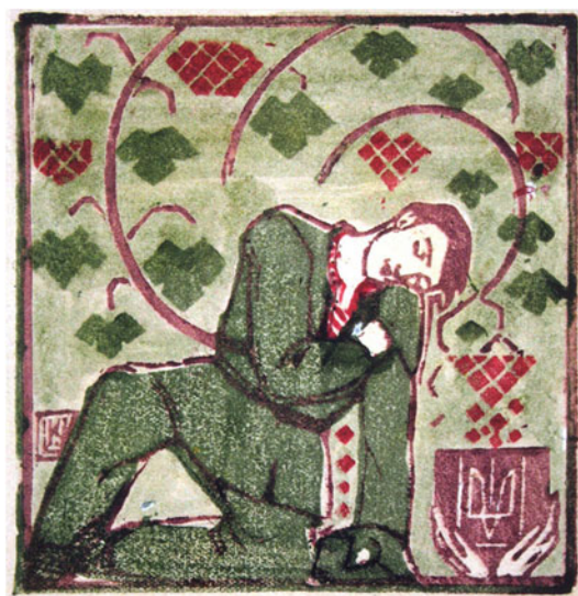
Рис. 4. лінорит “Стрілецька кров”, автор О. Кульчицька, 1920 р. Графіка, малярство, ужиткове мист., м. Львів, 2013 [1]