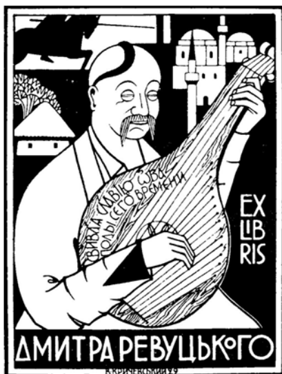
Рис. 3. екслібрис, автор В. Кричевський, 1929 р. Василь Григорович Кричевський: життя і творчість., Нью-Йорк, 1974 [8]

Жінки зображуються в образі жертви, матері, кріпачки: «Неволя» 1930 р., «Підневільна праця» 1930 р., матері «Мати» 1930 р.,