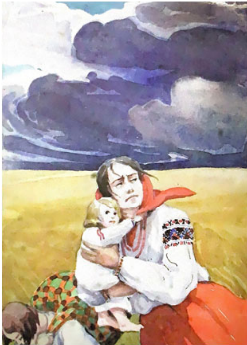
Рис. 1. графіка «Чорна хмара...» автор О. Кульчицька, 1914–1915 рр. Графіка, малярство, ужиткове мист., м. Львів, 2013 [1]

Також жінка може зображатися в образі святої, Богоматері, як в творі Олени Кульчицької «О, Мати Божа України!» (рис. 2) 1914–1915 рр., де авторка наче звертається до Богоматері, щоб вона захистила Україну від війни. Під час лихоліття люди часто