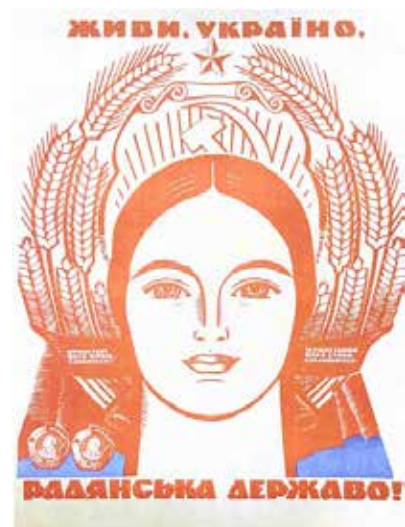
Рис. 8. Плакат, «Живи, Україно, радянська державо!», автор Є. Кудряшов, 1958 р. Українська ідентичність в графічному дизайні 1945–1989 рр., м. Київ, 2019 [4]

На цих обкладинках показано красу української жінки та все прекрасне і естетичне, що підкреслюється за допомогою зображення птахів, квітів, рослинних орнаментів. Наприклад, на обкладинці журналу (січень 1985 р.); (рис. 7) зображена українка, у вишитому одязі, темним волоссям, що ідентифікує її національну приналежність, зі снопом пшениці у руках. Пшениця є одним із загальновідомих символів України. Композиція аркуша є симетричною та статичною, тут використано біонічні мотиви, поєднано плавні і кутасті лінії, використано декоративні елементи, у вигляді мотивів на задньому плані та орнаментів на одязі жінки. Композиція виконана у яскравих контрастних трьох кольорах: біле тло, чорний та зелений. Також на обкладинках цього часопису зображено жінку в образі матері,