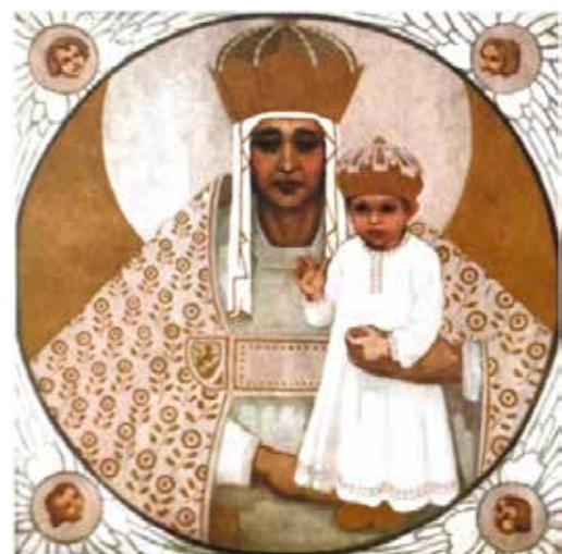
Рис. 2. графіка, ікона «О, Мати Божа України!» автор О. Кульчицька, 1914–1915 рр. Графіка, малярство, ужиткове мист., м. Львів, 2013 [1]

Також чоловіки зображуються в образах воїнів, повстанців, Січових стрільців, надприродних істот. «Хоробрі галицькі полки» 1915 р., «Гуцули-добровольці» 1915 р., у творі «Фантазія» 1915 р., де велетенський воїн в обладунках та касці зі зміями вилами проколює візуально зменшених за розмірами росіян. Візуальне зменшення розмірів