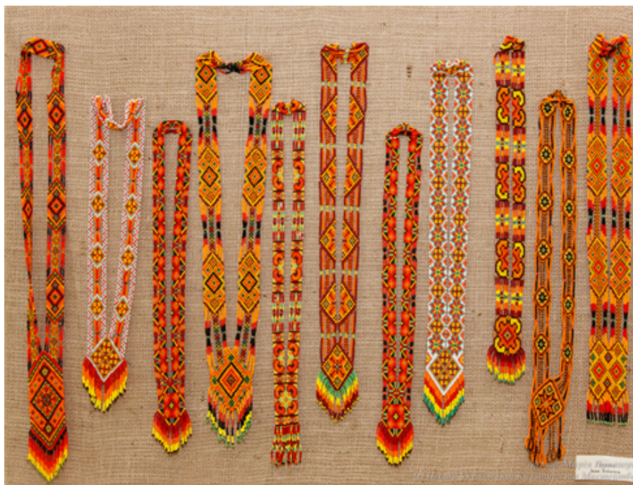
Рис. 2. Фрагмент експозиції виставки «Орнаменти буття». Центр Української Культури та Мистецтва, м. Київ, 2016 р.