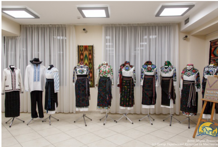
Рис. 1. Фрагмент експозиції VII Всеукраїнської виставки «Бісер: Вчора. Сьогодні. Завтра». Центр Української Культури та Мистецтва, м. Київ, 2019 р.

митців-учасників, де діти й дорослі вивчають традиційні техніки роботи з бісером в Україні.