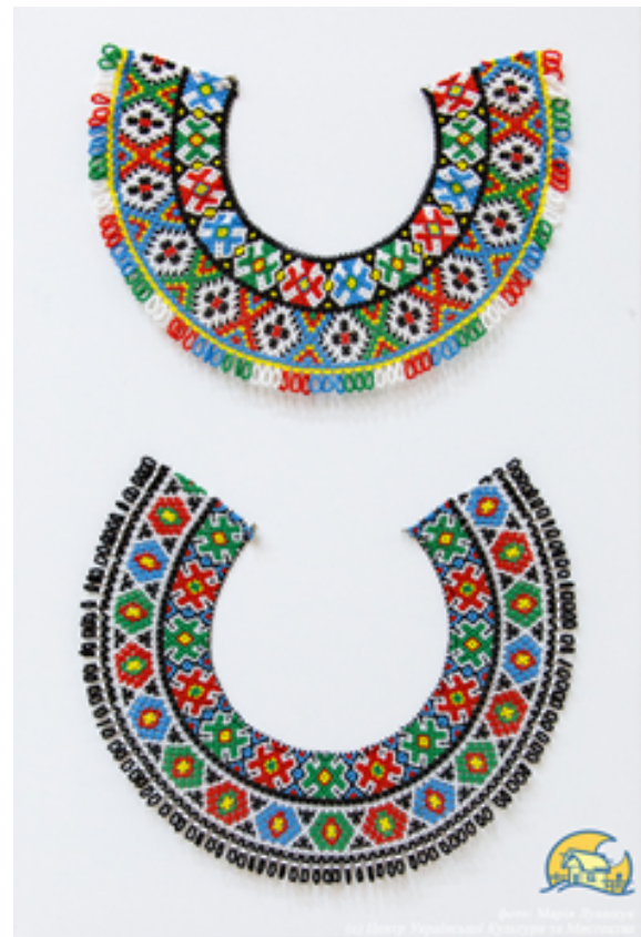
Рис. 4. Нагрудні прикраси-кризи. Майстриня Н. Артюхова

Разом із творчою складовою діяльності майстрів затребуваною є і їхня педагогічна