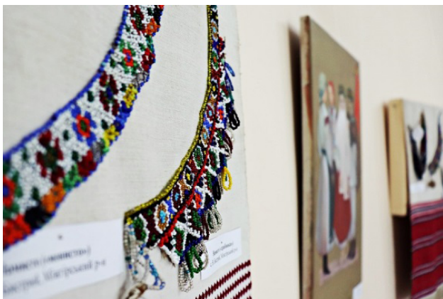
Рис. 3. Фрагмент експозиції виставки «Традиційні жіночі прикраси з бісеру». Закарпатський обласний музей народної архітектури та побуту, 2023 р.

Разом із творчою складовою діяльності майстрів затребуваною є і їхня педагогічна робота, у межах якої діти та дорослі отримують знання щодо основ роботи з бісером,