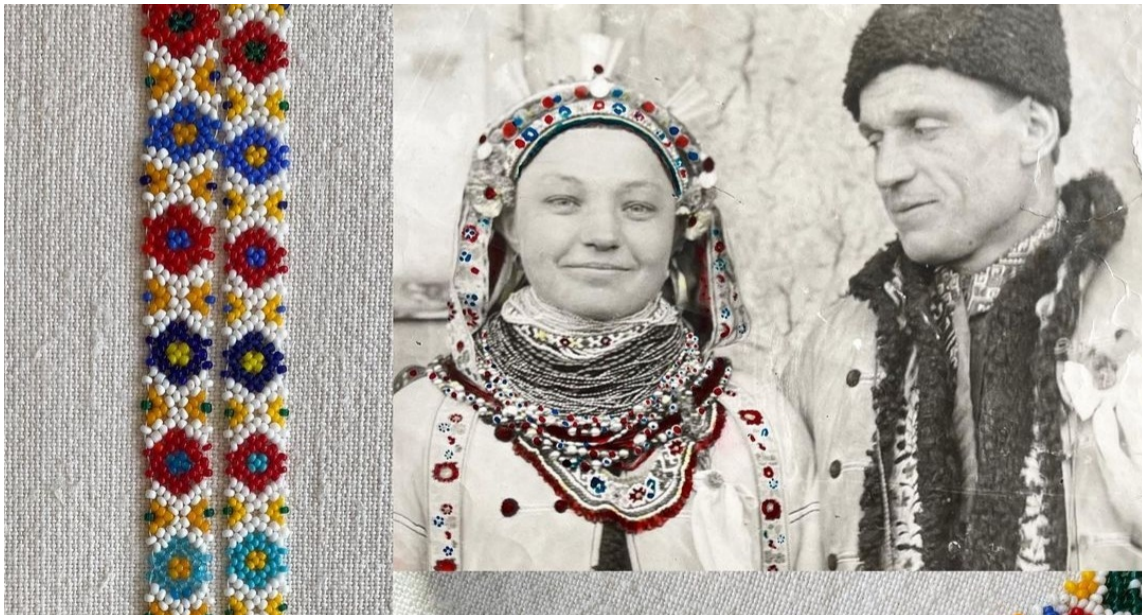
Рис. 6. Відтворені брендом традиційних прикрас «Ружа» силянка й гердан, с. Топорівці Івано-Франківської обл.

мистецтва та навчають всіх охочих основам роботи з бісером. Цей напрям підтримують і такі етнофестивалі, як «Галицька брама», «Граждafest», «Дзвони Лемківщини», «Країна мрій», «Лудине-фест».