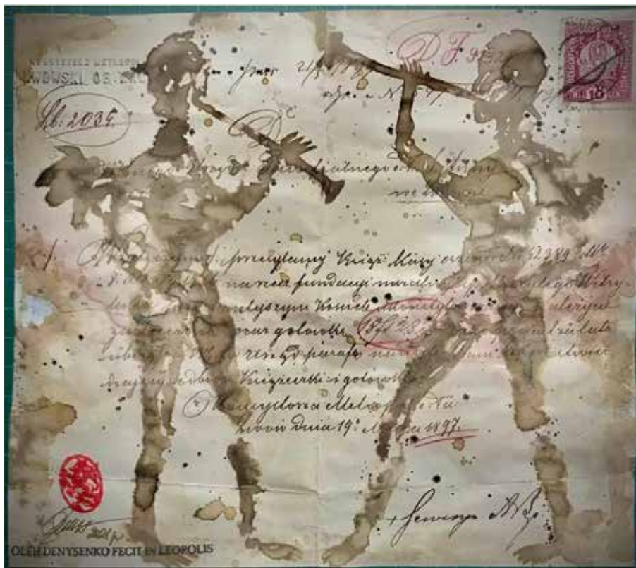
Рис. 1. Старим паперам – нове життя – 3, еколін 2021 р.

Роботи автора, які представлені в статті, об'єднані технікою до якої Денисенко звертатиметься в різних творах. Експериментальні пошуки митця, в його трактуванні вибору техніки, матеріалів, паперу для робіт, зазначені як «еколін», в статті буде збережений