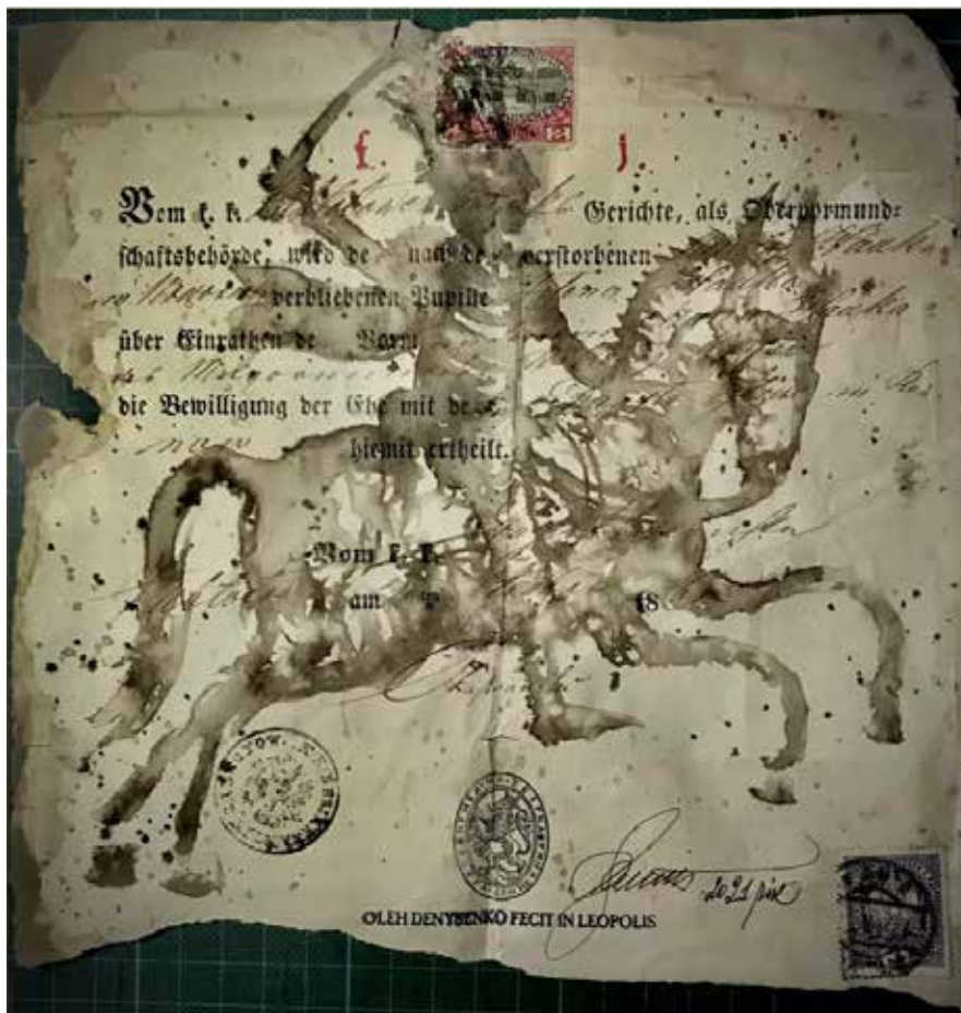
Рис. 2. Папір старий, – життя нове – 2, еколін, 2021 р.

ним акцентом виступають наявні авторські печатки, ескібриси, створені в різні творчі періоди.